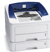
Illustration de la Phaser 3250 avec le magasin 2 en option