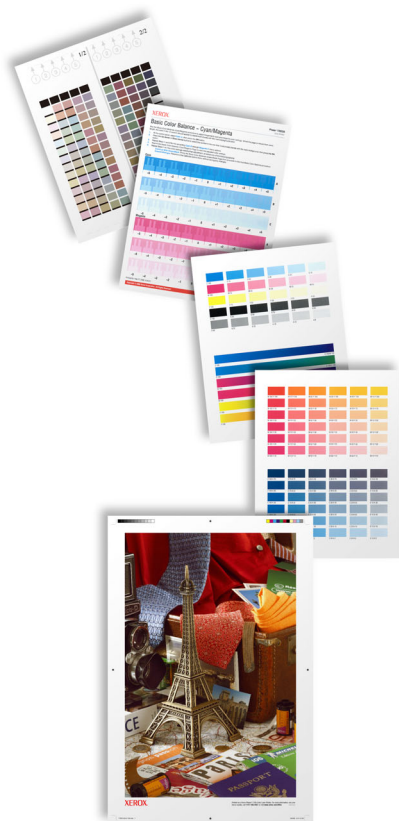
Des outils intégrés d'étalonnage des couleurs donnent les résultats désirés.