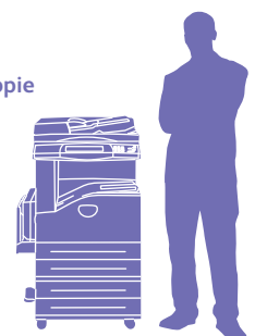
WorkCentre 5230 avec module Deux magasins