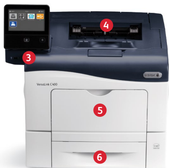
Imprimante couleur VersaLink® C400 de Xerox® Impression.

1 Les ports USB peuvent être désactivés. 2 VersaLink® C405 seulement.