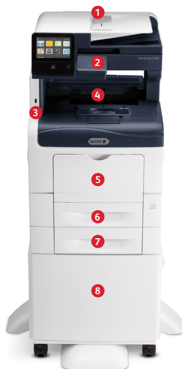
Imprimante couleur multifonction VersaLink® C405 de Xerox® Impression. Copie. Numérisation. Télécopie. Courriel.